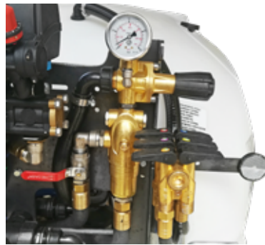
Κιτ υψηλής συγκέντρωσης