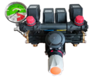
Ηλεκτρικός έλεγχος 2 κατευθύνσεων με ηλεκτρική πίεση