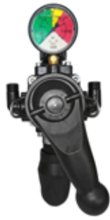
Χειροκίνητο τηλεχειριστήριο ενός μοχλού