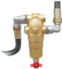
Φίλτρο παράδοσης από ορείχαλκο