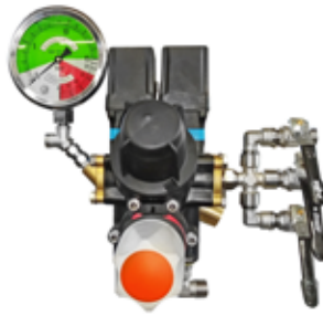
Ηλεκτρικός έλεγχος 2 κατευθύνσεων με χειροκίνητη πίεση