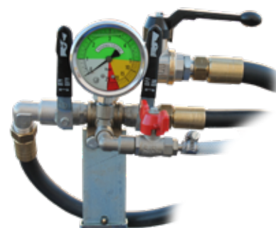
Χειροκίνητος έλεγχος από απόσταση