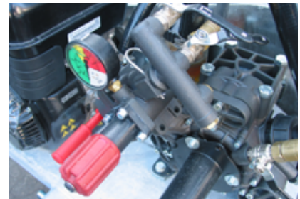
Βαλβίδα ρύθμισης πίεσης με βαλβίδα στρόφιγγας για την εντολή των αναδύσεων εκτόξευσης και του μετρητή