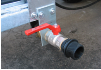
Βαλβίδα εκκένωσης για να αδειάσει τα χημικά υπολείμματα της δεξαμενής