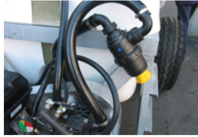
Φίλτρο τομής με βαλβίδα διακοπής, φίλτρο 50 mesh για εύκολη συντήρηση