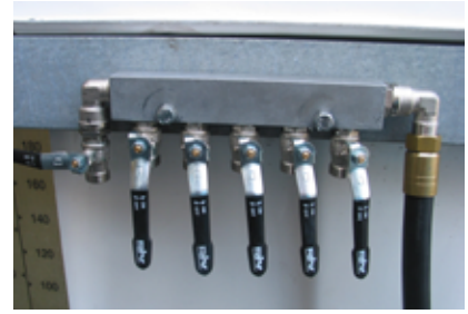
Βαλβίδα συλλέκτη με 6 στρόφιγγες για λειτουργία με 6 χρήστες ταυτόχρονα