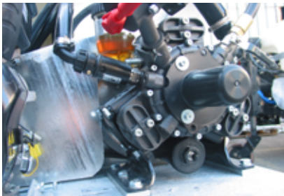
Αντλία πολλαπλών διαφραγμάτων με βαλβίδα ασφαλείας για προστασία του υδραυλικού κυκλώματος