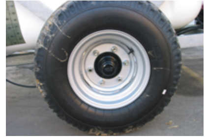
Σωληνωτοί τροχοί 11,5/80 - 15,3 τοποθετημένοι σε πλήμνη 6x6 και ρυθμιζόμενοι άξονες εξοπλισμένοι με κωνικές ράβδους πρώτης κατηγορίας