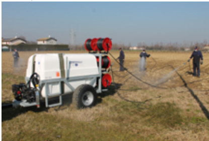
Σταθμοί ψεκασμού κατάλληλοι για 6 χρήστες και έναν οδηγό για να ψεκάσουν ανεξάρτητα το μείγμα έως και 100 μέτρα από τον ψεκαστήρα