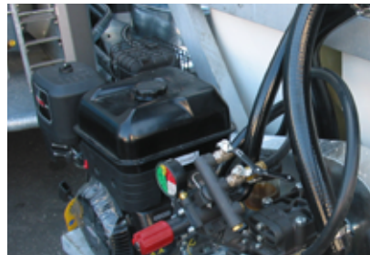
Τετράχρονος κινητήρας βενζίνης Briggs-Stratton 14 HP