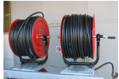
Καρούλι λάστιχου με λάστιχο 100 μέτρων 10x19 80 Bar