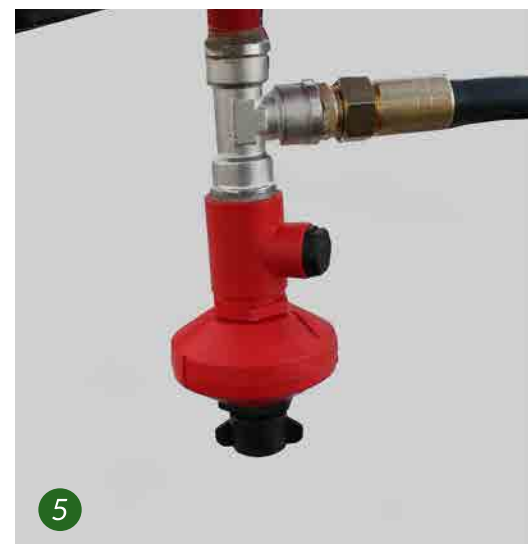
1. Κεφαλή με πιστόλια και υδραυλικά ακροφύσια 2. Χειροκίνητος έλεγχος 3. Φίλτρα πριν από τα ακροφύσια