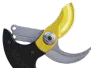
KIT MAXI Ø 55 mm

Αυτό το kit προσφέρει μεγαλύτερη ικανότητα κοπών διατηρώντας μια ταχύτητα προσαρμοσμένη στην εφαρμογή σας.