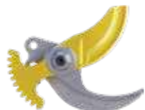
KIT MEDIUM Ø 45 mm

Ιδανικό για κλάδεμα της αμπέλου και κατάλληλο για κλάδεμα δενδροκαλλιέργειας. Αυτό το kit είναι ο καλύτερος συνδυασμός ταχύτητας κοπής και δύναμης.