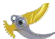
KIT STANDARD Ø 40 mm

Αλλάξτε απλά, μόνοι σας, κεφαλή κοπής σύμφωνα με τις ανάγκες σας.